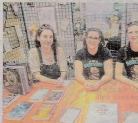
Le club de lecture les Dragons curieux.

Une trentaine d'associations étaient présentes des associations, le 9 septembre, à l'espace liberté. Celles-ci couvraient le domaine du culte de la solidarité, du culturel, de la santé et du bien-être corporel, de l'artistique, de l'environnemental, de la citoyenneté. Les associations sportives étaient très présentes et beaucoup sont venues faire renouveler leur adhésion ou pour un soutien. Le handball club annonçait sa journée verte et portes ouvertes à la halle des sports le 17 septembre et son vide-grenier le 18. Parmi les nouveautés figurait l'art martial vietnamien avec la Viet Vo Dao-Mai hoa. Le badminton club avait de nombreuses démonstrations sur scène.